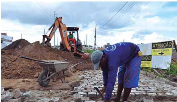
Projeto inclui trabalho de drenagem, terraplanagem e pavimentação