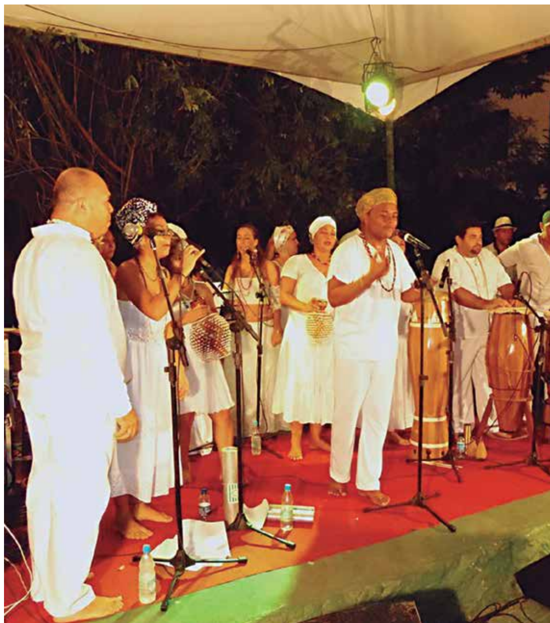
O Grupo Raízes foi criado no próprio ateliê, onde desenvolve atividades ligadas à cultura afro

Já o Grupo Raízes é um produto cultural do Ateliê, que se caracteriza por ser um grupo de dança e percussão afro-brasileira e indígena, que realiza um trabalho de fortalecimento da cultura popular paraibana, bem como de desconstrução de preconceitos relacionados à intolerância religiosa. Coco, ciranda, maracatu, samba de roda, ijexá, perré, maculelê, entre outros, compõem o arcabouço de ritmos que estruturam a base do grupo, servindo de referência para a construção de uma linguagem artística própria.