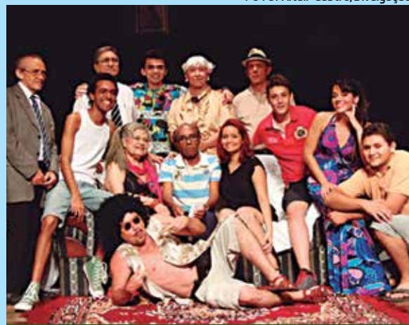
O grupo Tenda apresenta uma comédia de costumes