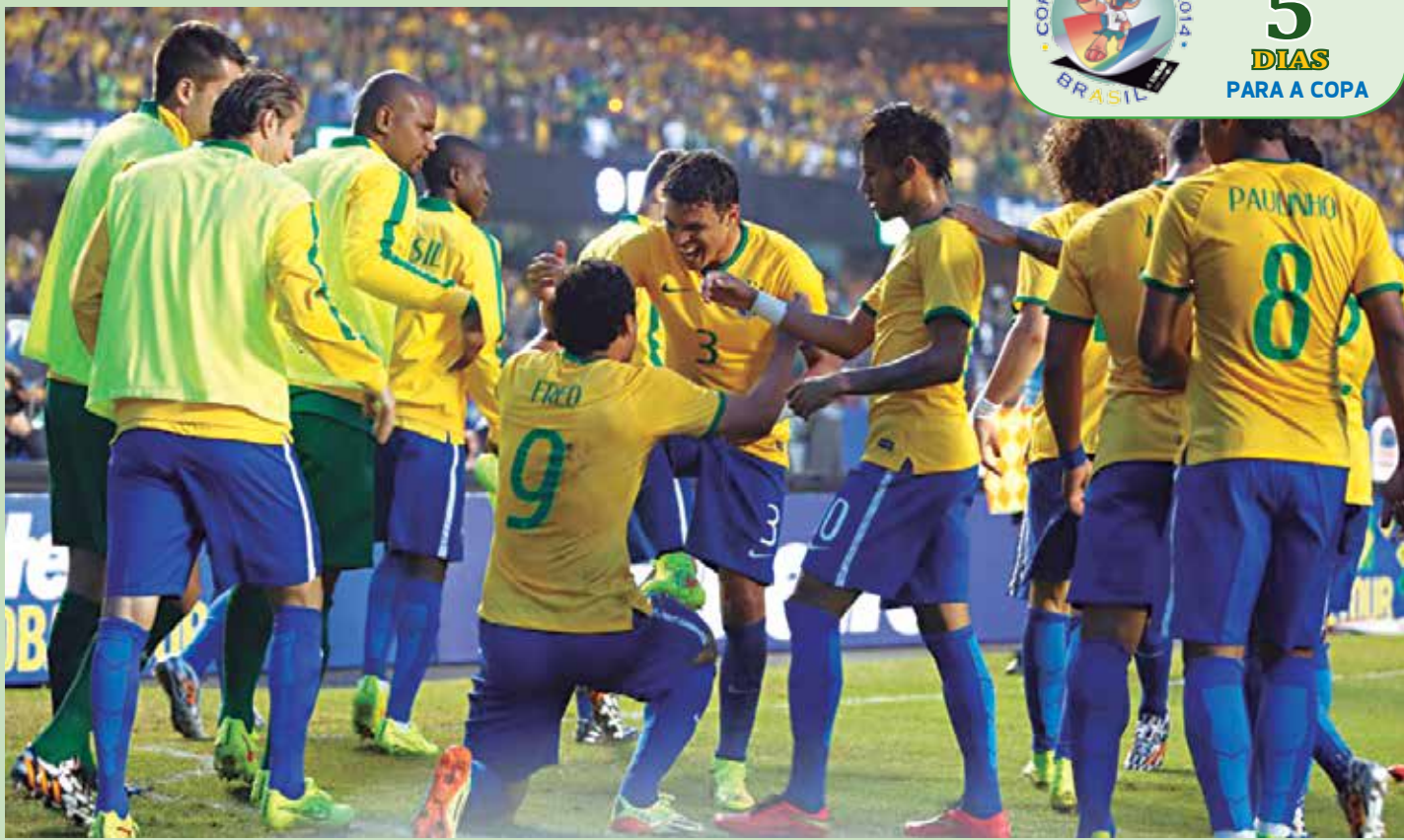
O único gol da seleção do Brasil foi do atacante Fred, em uma bela jogada individual aos 13 minutos do segundo tempo