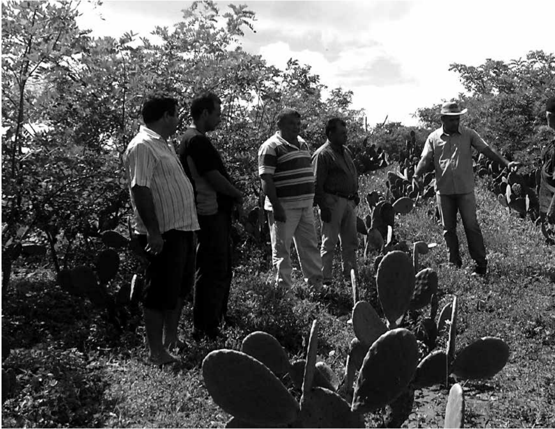
Produtor ganha prazo de carência de até três anos e juros diferenciados para pagar a dívida

Apenas em 2013, foram regularizadas 14.575 operações de produtores rurais afetados pela seca, junto ao Banco do Nordeste na Paraíba, alcançando o montante de R$ 78,7 milhões em dívidas renegociadas. Para 2014, a expectativa da instituição financeira é que sejam regularizadas cerca de 30 mil operações, que devem alcançar os R$ 77,2 milhões em todo o Estado, com base nos instrumentos legais de renegociação de dívidas rurais atualmente em vigor (Lei 12.844/2013; e resoluções 4.211, 4.212, 4.250, 4.251, 4.298, 4.299 e 4.315).