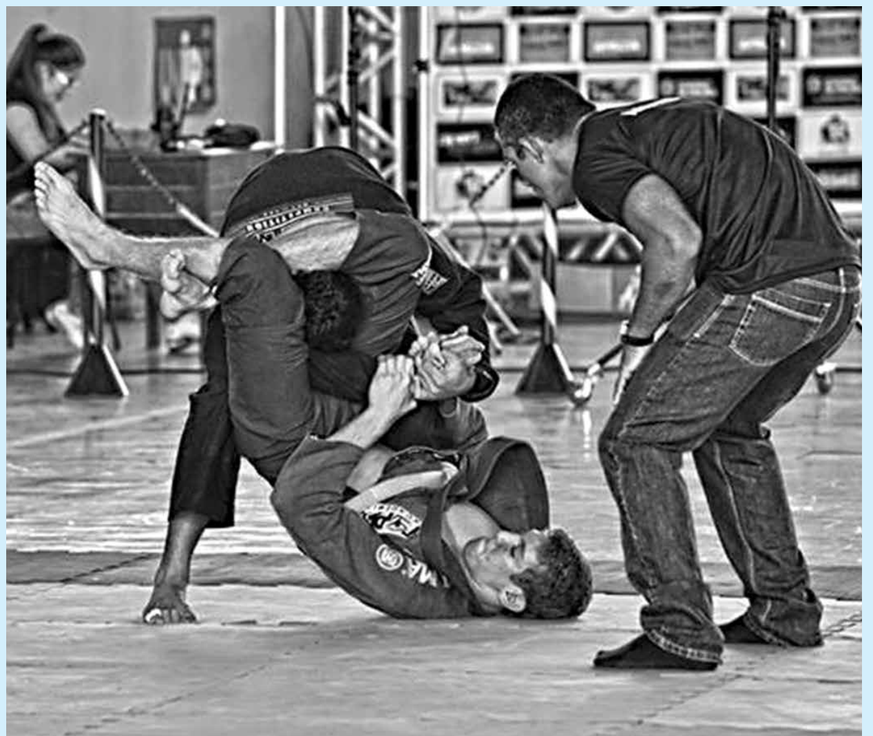
Competição no Unipê tem o objetivo de desenvolver a prática esportiva como instrumento de promoção social

Haverá uma premiação em dinheiro no valor de R$ 5 mil, além de uma moto que será ofertada. Haverá também medalhas para os melhores colocados, conforme garantido de forma prévia os organizadores.