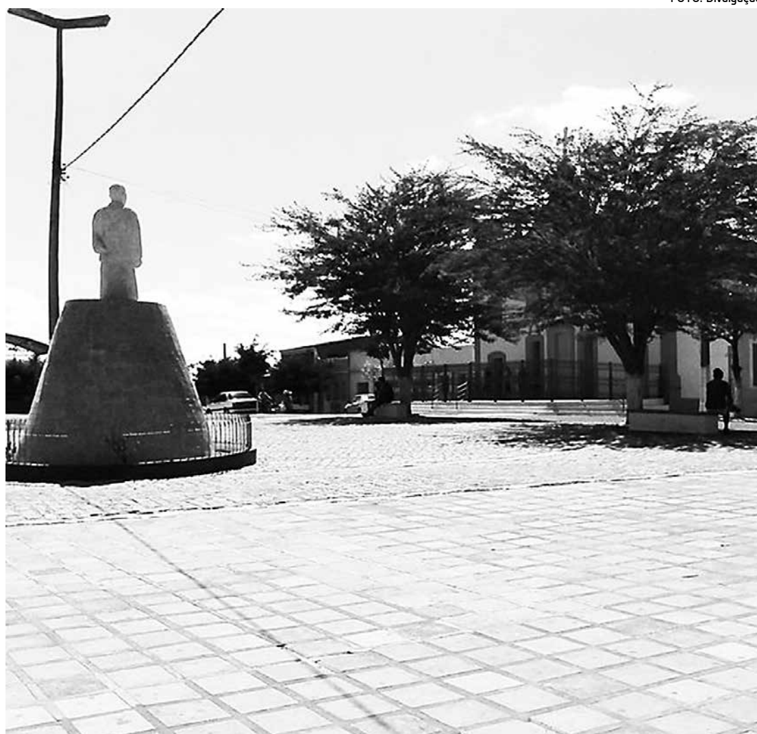
Cidade de Boa Vista, pelo número de habitantes hoje e pela nova lei, não conseguiria aprovação

A proposta aprovada na Câmara retirou a exigência. O texto também excluiu a necessidade de um núcleo urbano mínimo como condição para a criação de distritos. Os deputados argumentaram que da forma como