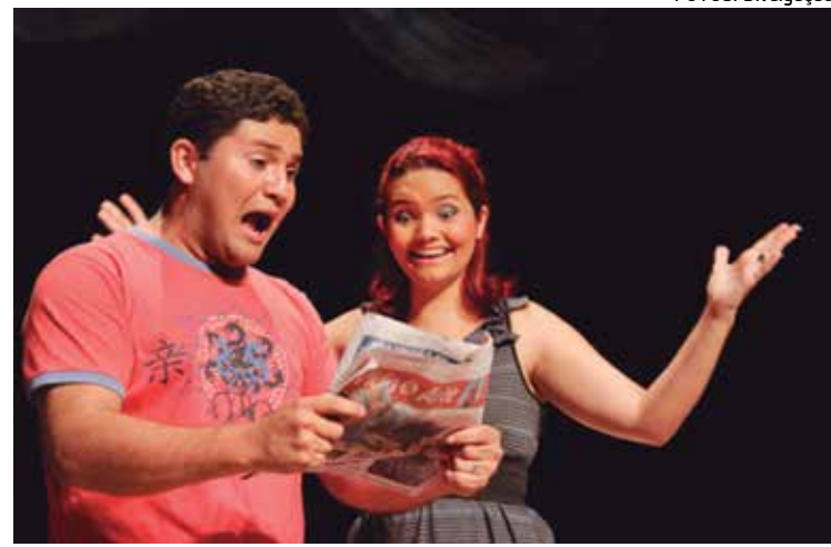
Cenas do espetáculo que retrata o cotidiano de uma família da Rua das Trincheiras, localizada no centro da capital, com situações engraçadas do cotidiano da casa