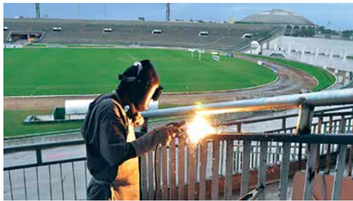
Esta é a primeira vez que o estádio passa por uma grande reforma